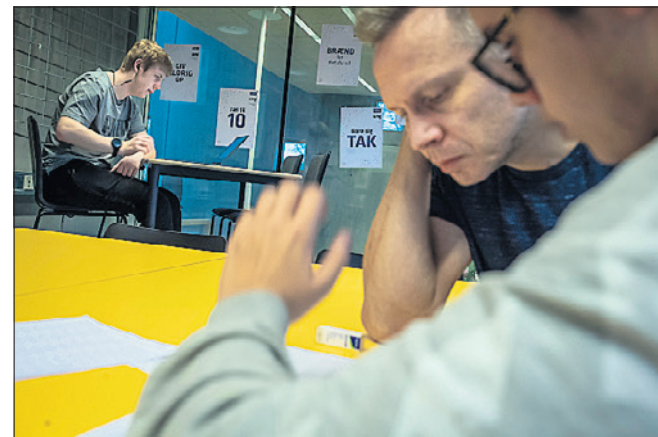
Der er mere tid til at hjælpe den enkelte elev her i Basic Skills.

» Jeg har fået nye venner. Og jeg lærer mere. Det er jo en ungdomsskole, så det er lidt anderledes.