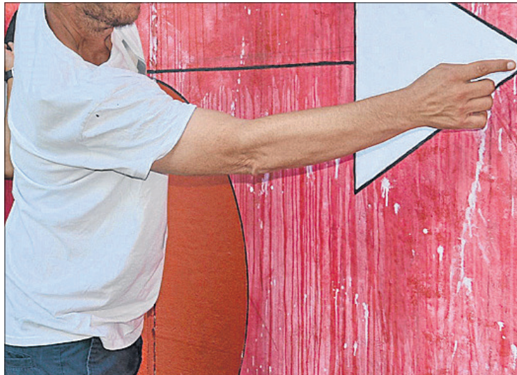
"These Shapes are made for Dancing" er en leg med krop, geometri og koreografi med muren som partner.