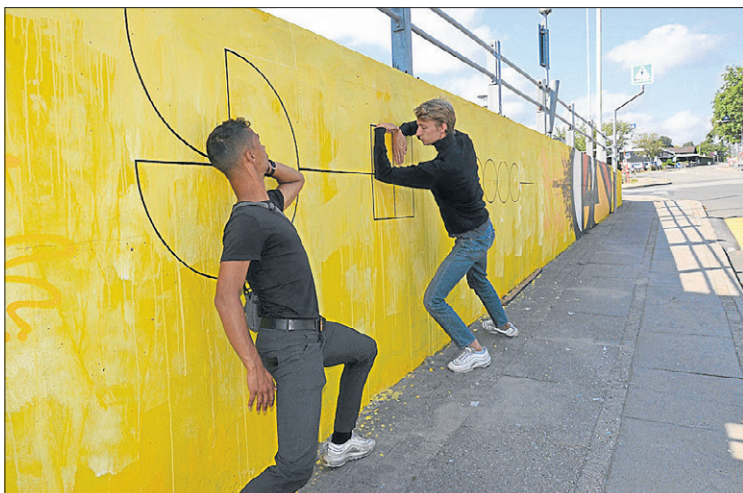
Dans op af muren ved Citycentret i Støvring.

- Samtidig kan murene også bruges til tværfaglig undervisning. De inddrager nemlig både billedkunst, matematik og bevægelse, slutter hun.